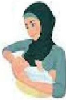
گهواره ای برعکس