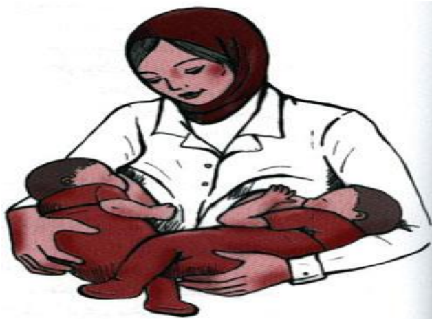
گهواره ای متقابل