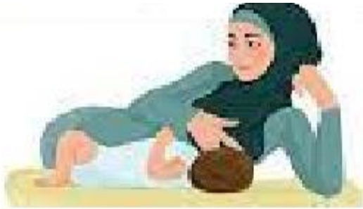
روش خوابیده په پهلو